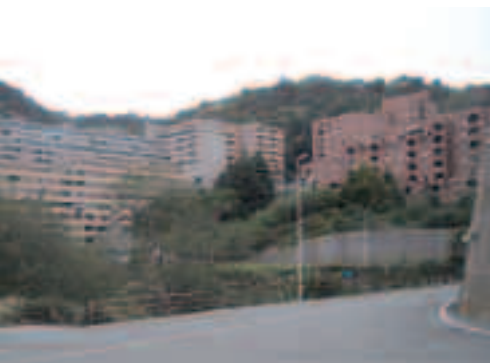
La vista verso Genova Voltri e altri scorci delle Case di edilizia popolare The view of Genoa Voltri and other parts of the district